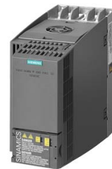
Figura similar Figure similar

Referencia : 6SL3210-1KE21-3UF1 Article No. :